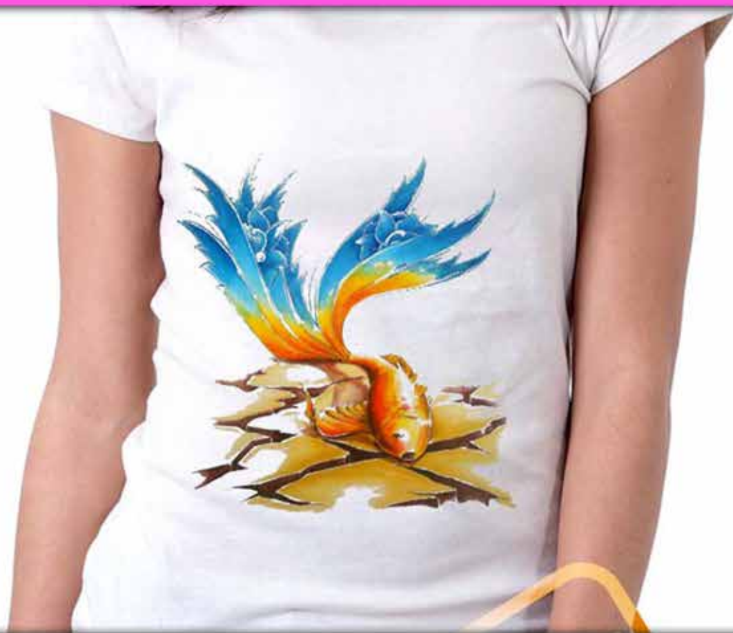
طرح ماهی : ترکیب انتزاعی ماهی و گل اسلیمی که از وجودش رشد کرده است