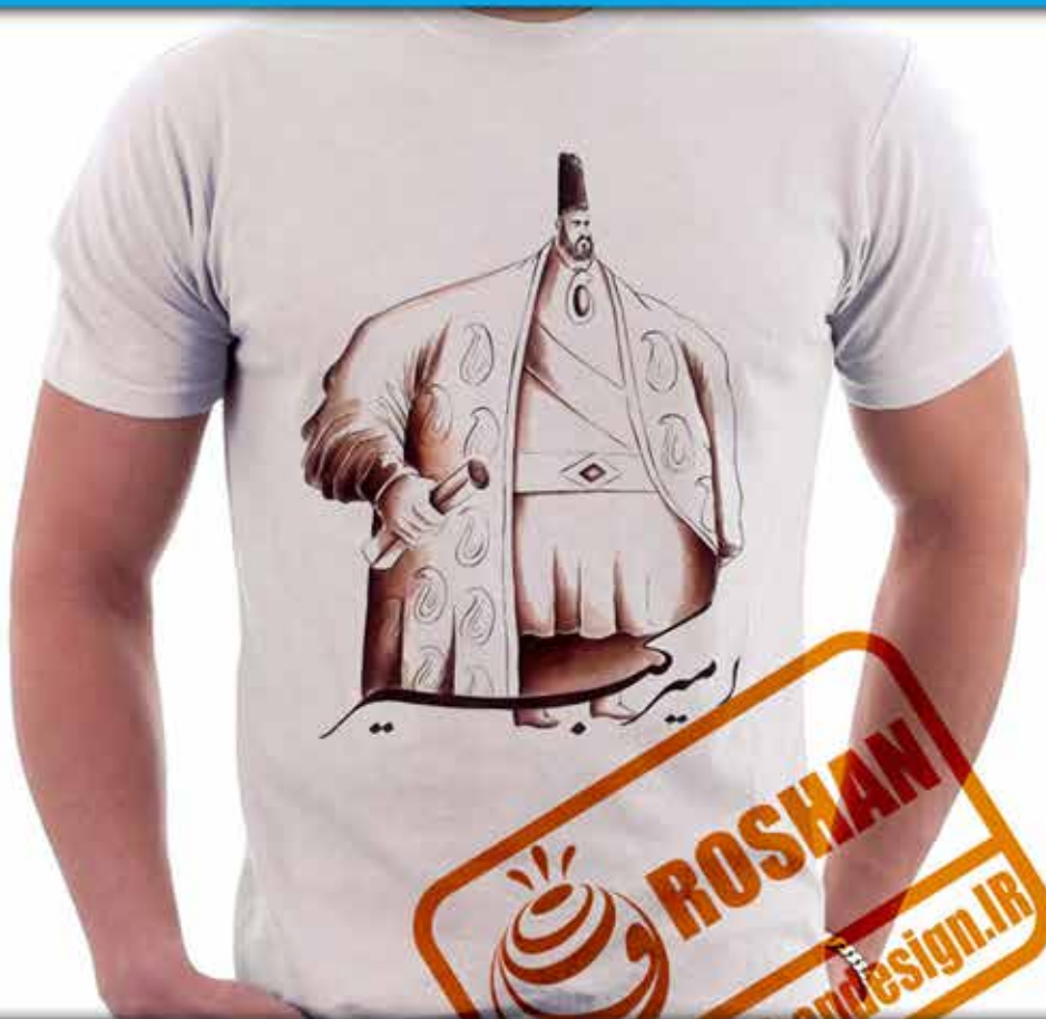
طرح کاریکاتور امیر کبیر : کاریکاتور میرزا محمد تقی خان فراهانی مشهور به امیر کبیر