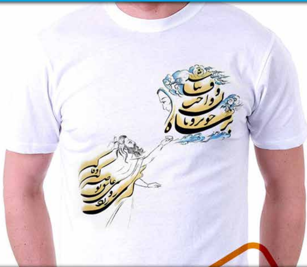
طرح شاه خوبرویان : طلب لطف و نظر عاشق از معشوق شعر(بر شاه خوبرویان واجب وفا نباشد ای زرد روی عاشق تو صبر کن وفا کن حافظ)