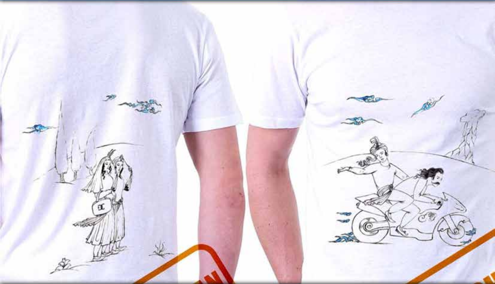
طرح موتور : نگارگری معاصر، مضحک قلم به سبک نگارگری دوره صفویه