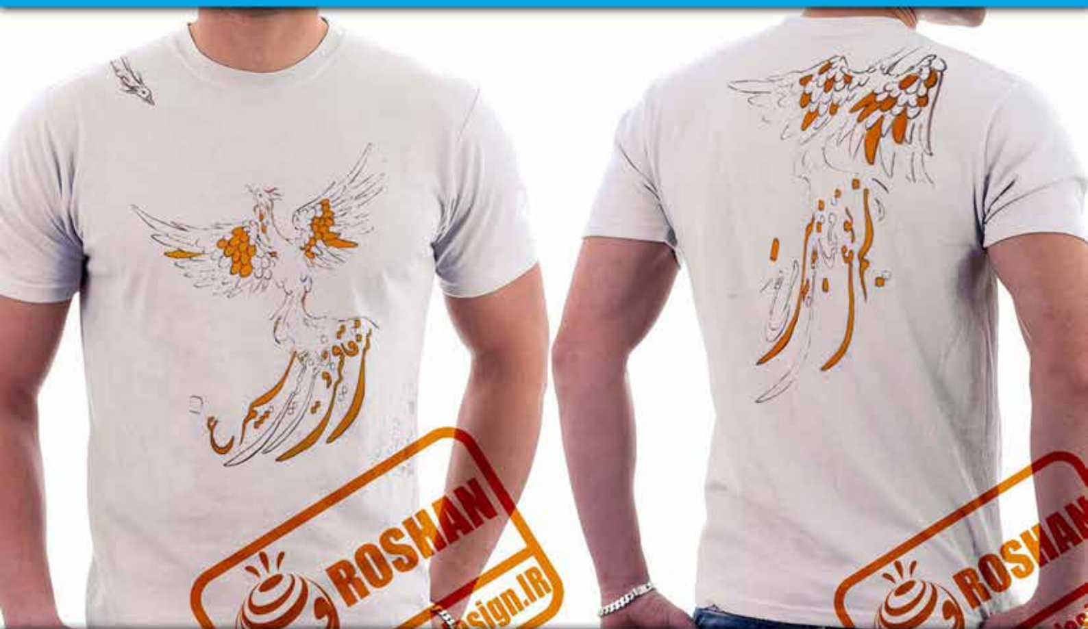
طرح سی مرغ : شعر(تنت قافست و جانت هست سیمرغ زسیمرغی تو محتاجی به سی مرغ عطار)