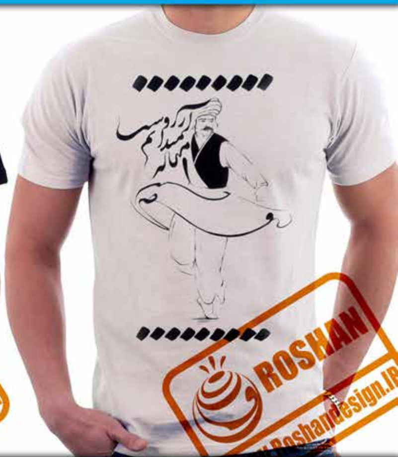
طرح رقص هتن ۱ : نوعی سماع عارفانه شعر (...رقصی چنین میانه میدانم آرزوست مولانا)