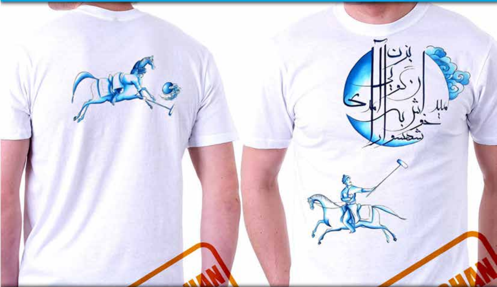
طرح چوگان : از ورزشهای کهن ایرانی است که به ورزشی جهانی تبدیل شده است شعر...شهنسوارا خوش به میدان آمدی گویی بزَن حافظ