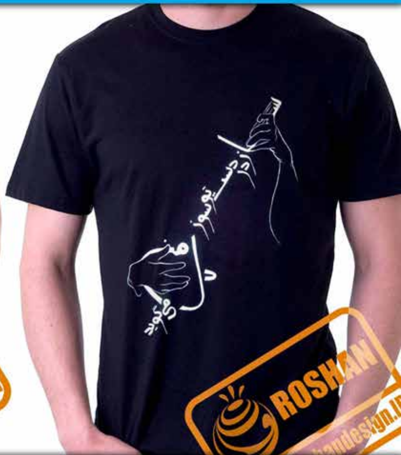
طرح سه تار : از سازهای زهی و مضرابی ایران شعر (ساز در دست تو سوز دل من می گوید من هم از دست تو دارم گله چون ساز امشب شهریار)