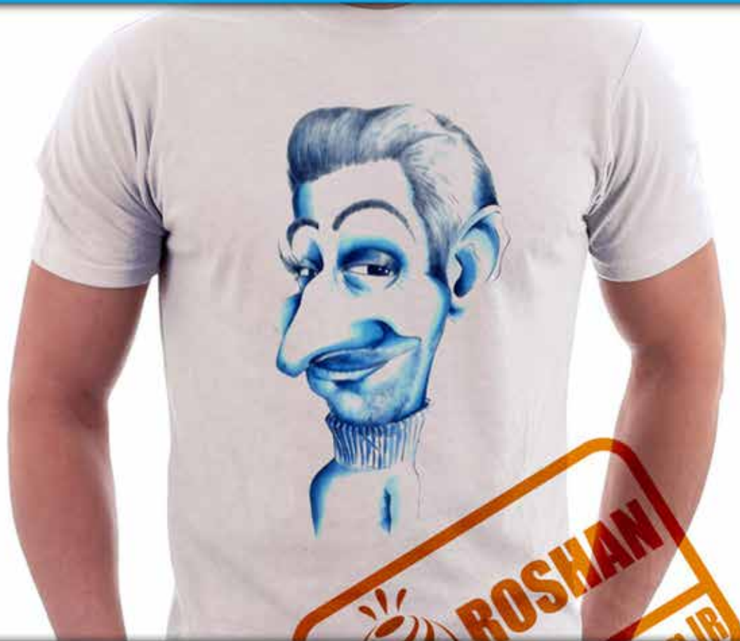
طرح کاریکاتور : کاریکاتور یا پرتره علاقه مندان بر روی تیشرت