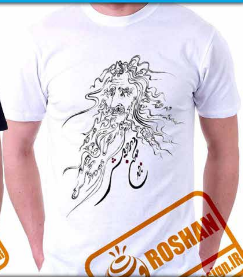
طرح پریشان : نگارگری درویشی پریشان و نالان شعر(درویش مکن ناله ز شمشیر احباء... حافظ)