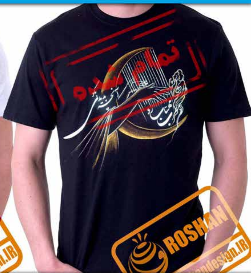
طرح چنگ : از سازهای زهی ایران شعر (ما همگان محرمیم آنچه بدیدی بگو مطرب مهتاب رو آنچه شنیدی بگو مولانا)