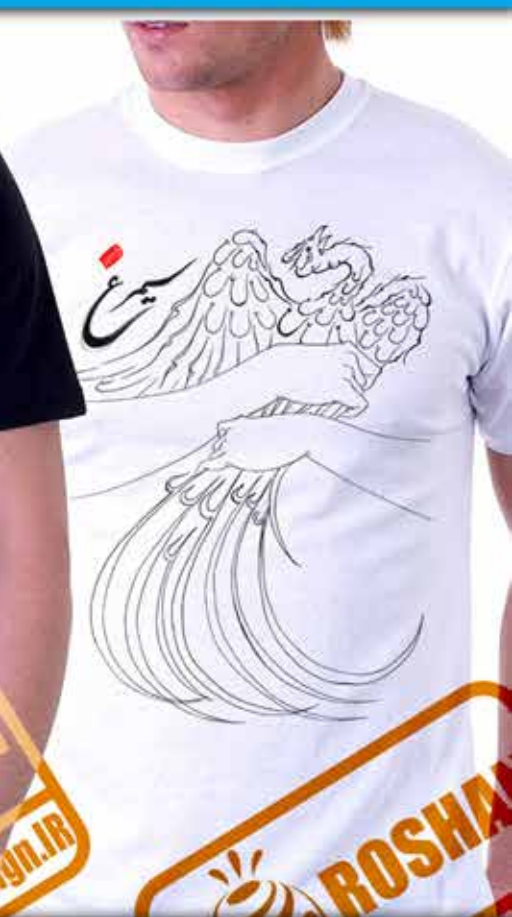
طرح سیمرغ در آغوش : تایپوگرافی سیمرغ پرنده افسانه ای ایران