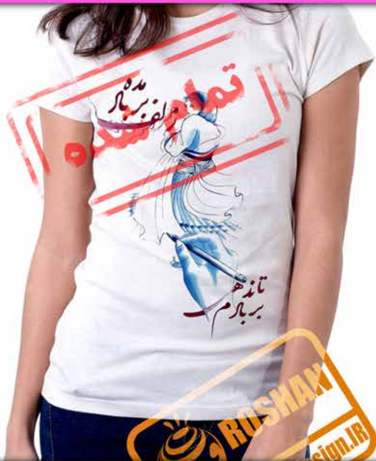
طرح زلف : دختر گالش (گیلانی) با لباس محلی شعر (زلف بر باد مده تا ندهی بر بادم ناز بنیاد مکن تا نکنی بنیادم حافظ)