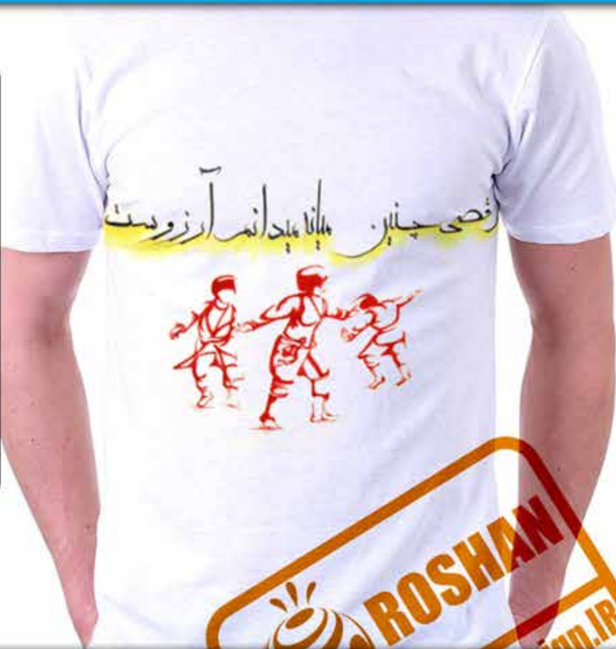
طرح ذکر خنجر : رقصی از آیین نمایشی اقوام ترکمن شعر (رقصی چنین میانه میدانم آرزوست مولانا)

۱۰ کوپن مخفی: Roshanart ۷۰٪ تخفیف این کوپن فقط شامل مجموعه رقص ها میشود.