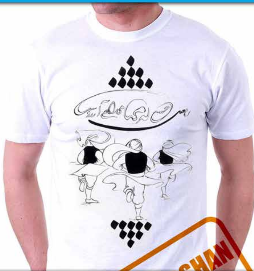
طرح هتن ۲ : نوعی سماع عارفانه شعر (...رقصی چنین میانه میدانم آرزوست مولانا)