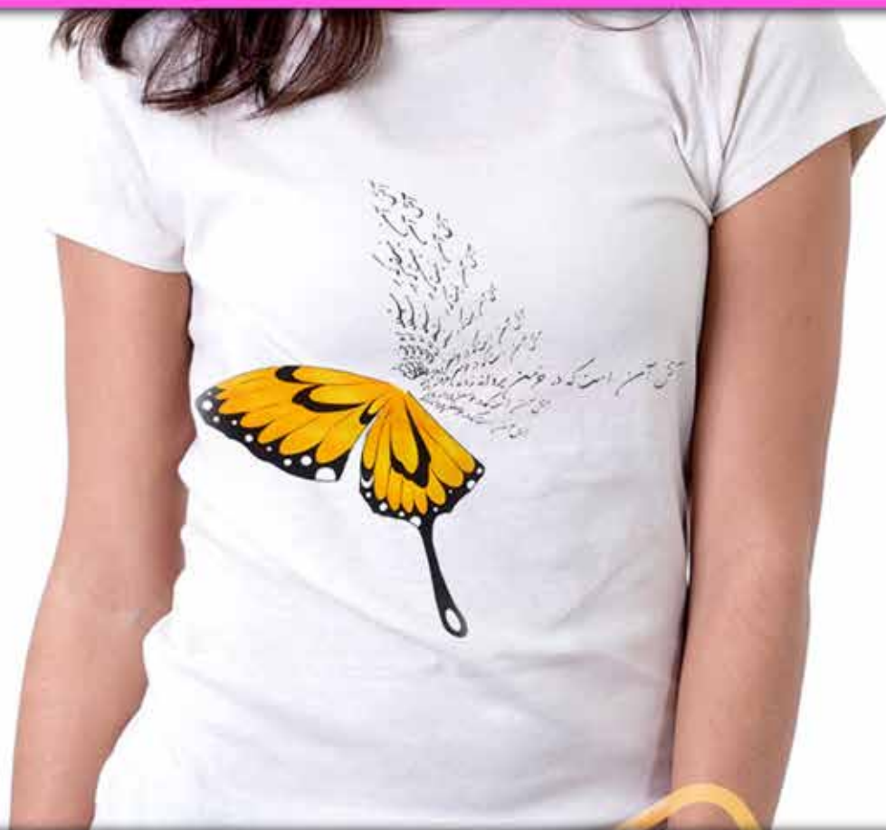
طرح پروانه : تایپوگرافی پروانه شعر (آتش آن نیست که بر شعله او خندد شمع آتش آن است که در خرمن پروانه زدند حافظ)