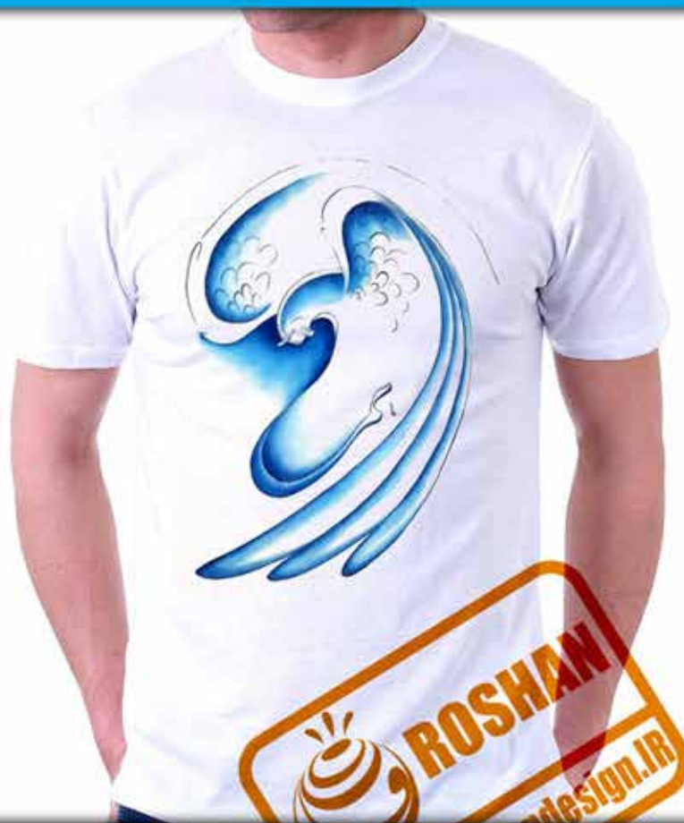
طرح هما : اسطوره ایرانی که سایه اش بر سر هرکس بیافتد به سعادت می رسد