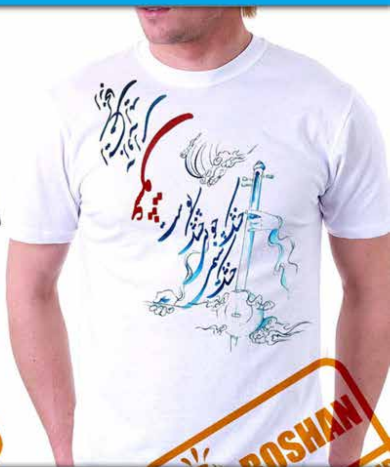
طرح کمانچه : از سازهای اصیل موسیقی ایران شعر (خشک سیمی، خشک چوبی، خشک پوست از کجا می آید این آوای عشق مولانا)