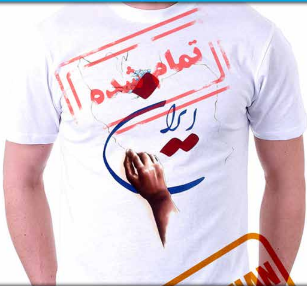
طرح ایران زمین : نقشه ایران و دست مردمان جنوب که مرز وطن را حفظ کرده اند