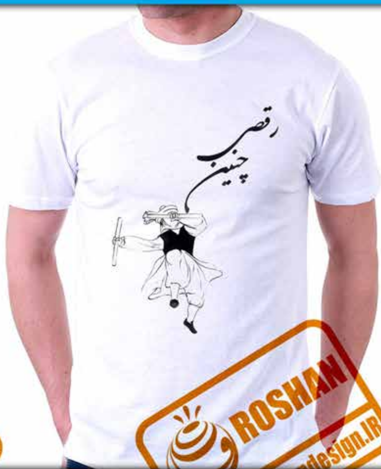
طرح چوب بازی : نوعی رقص که با چوب اجرا می شود شعر (رقصی چنین میانه میدانم آرزوست مولانا)

۱۰ کوپن مخفی: Roshanart ۷۰٪ تخفیف این کوپن فقط شامل مجموعه رقص ها میشود.