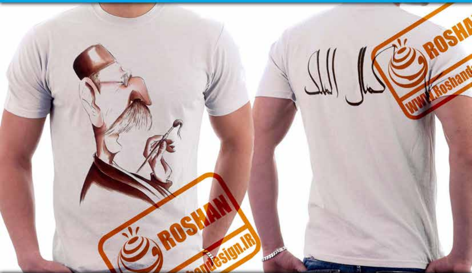
طرح کاریکاتور کمال الملک : استاد محمد غفاری نقاش ایرانی