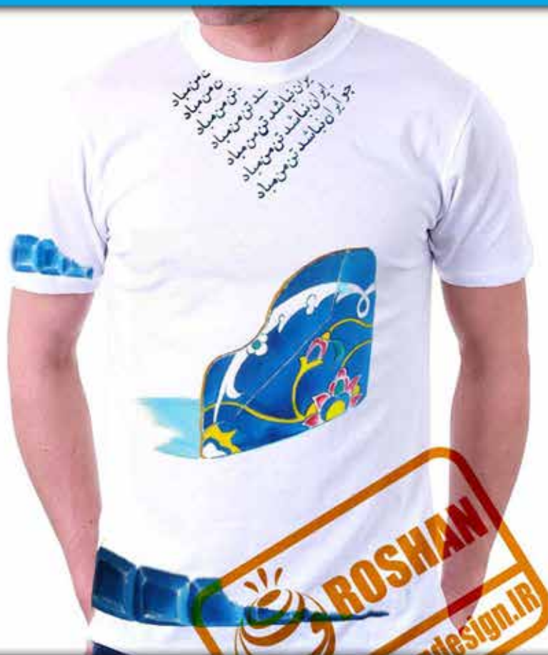
طرح کاشی اسلیمی : هنر اصیل و عرفانی ایران در معماری شعر (چو ایران نباشد تن من مباد)