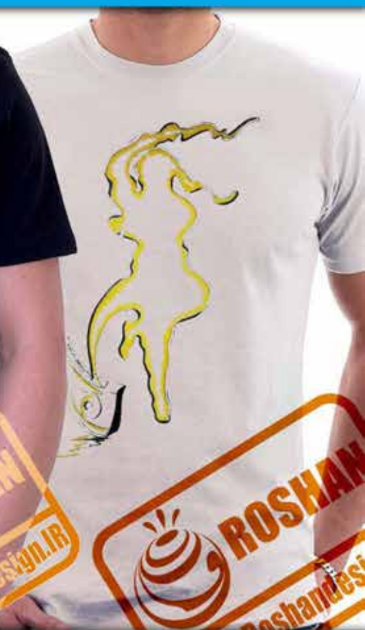
طرح رقص کردی : govend، بخشی از آئین نمایشی کردها است