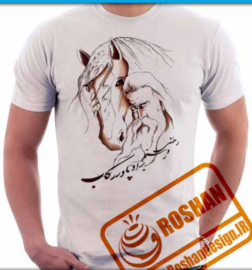
طرح رخس و رستم؛ شعر (رخشی و رستم بر او پا در رکاب... استاد علیرضا شجاعی پور)