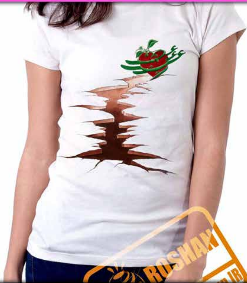
طرح عشق : کویر وجود آدمی بواسطه عشق سرسبز می شود