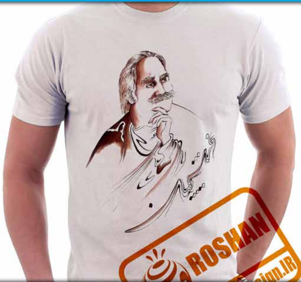
طرح فرشچیان : پرتره استاد فرشچیان به سبک نگارگری برگرفته از آثار وی