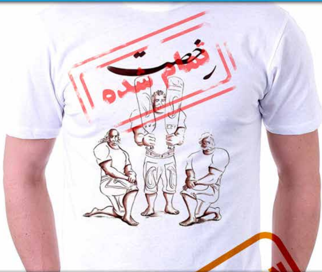
طرح رخصت : ورزش زورخانه ای یا باستانی که از آیین های پهلوانی ایران است رخصت(اجازه گرفتن از سادات و پیشکسوتان)