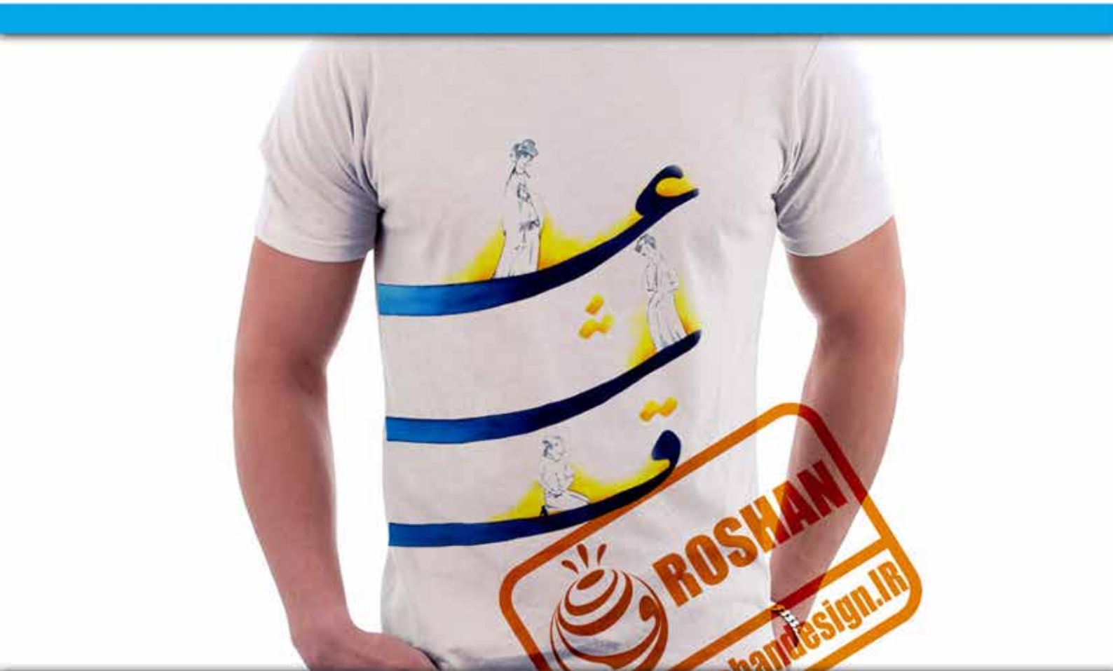
طرح عشق : حرف نگاره های عشق به همراه نگارگری دوره صفویه